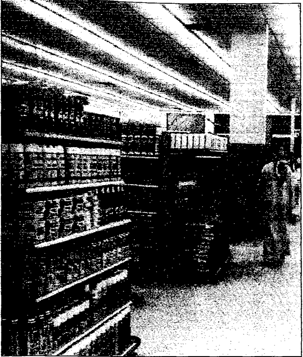
الترشيح يبدأ بوقف الاسراف

يقدم: ناصر الرشيد استعرضنا في الحلقة السابقة أحوال الاقتصاد السعودي وناقشنا موضوعي القمح والوظائف النسبية وفي حلقة اليوم سنحلل المواضيع المتعلقة بالاسراف الاستهلاكي وإمالة أمد عقود الدولة والعلاج في الخارج.